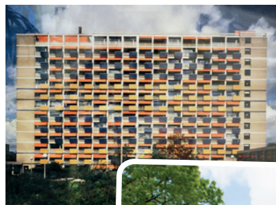
Links het 'Oude Schouw', onder de huidige locatie.

In de folder van het Oude Schouw werd het zorgcentrum als volgt beschreven: 'Het Schouw is een modern flatgebouw met 13 verdiepingen, waar plaats is voor 346 bewoners. Op de bovenste verdieping zijn 14 kamers voor personeelsleden. Bovendien is er een ziekenafdeling met 22 bedden. Het huis ligt gunstig in tuinstad Buikslotermeer, vlakbij het nieuwe winkelcentrum en met voldoende groen om te wandelen. Het huis biedt een geestelijk thuis voor mensen uit de vakbeweging en de socialistische kring. Alles in Het Schouw is erop gericht de bewoners in staat te stellen hun eigen leven te leiden met, zo nodig, een aangepaste verzorging.'