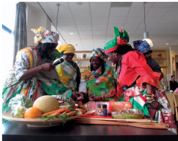
Keti Koti, 2015.

Wies: "Soms was het natuurlijk ook wel verdrietig, vooral mensen die onverwachts overleden."