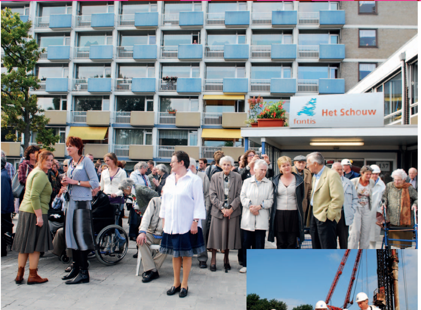
Eerste paal Ijdoornlaan, 2010.