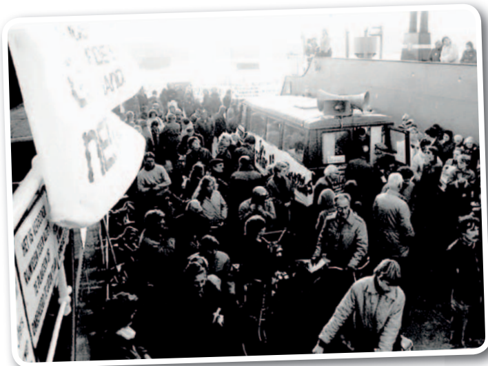
Het kapen van de pont, begin jaren '80.

We konden veel leren van de bewoners. Ik herinner me ook nog de demonstratie in het winkelcentrum tegen bezuinigingen van Brinkman, en we hebben een keer het kruispunt bezet. We zijn ook een keer met rood-witte paraplu's naar Den Haag getogen om te demonstreren voor 'een zorgeloze oude dag.'