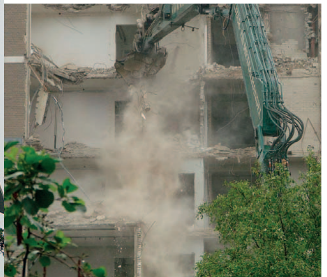
Sloop, 2011.