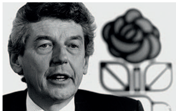
Wim Kok, jaren '90.