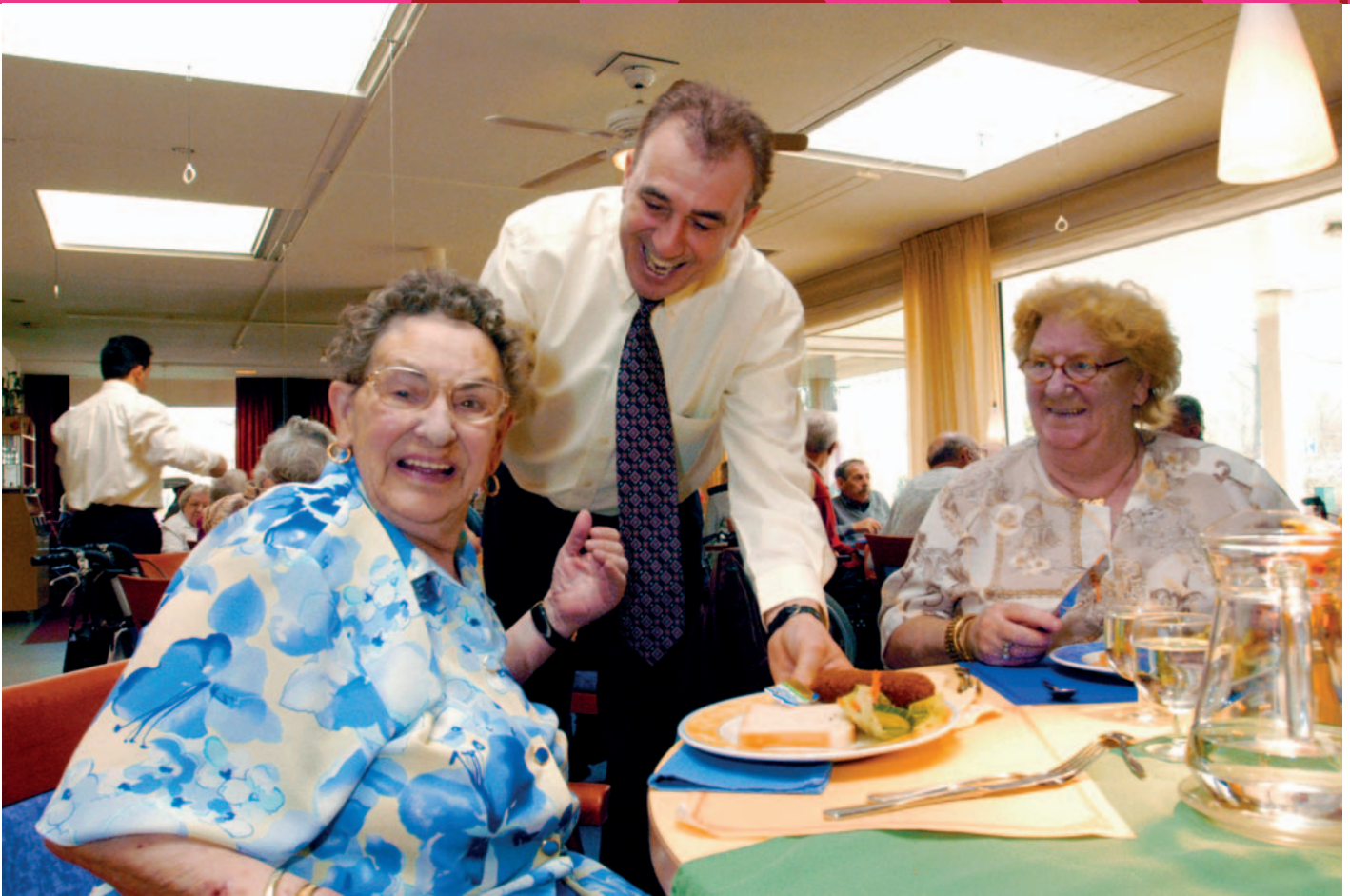
Het restaurant toen en nu.