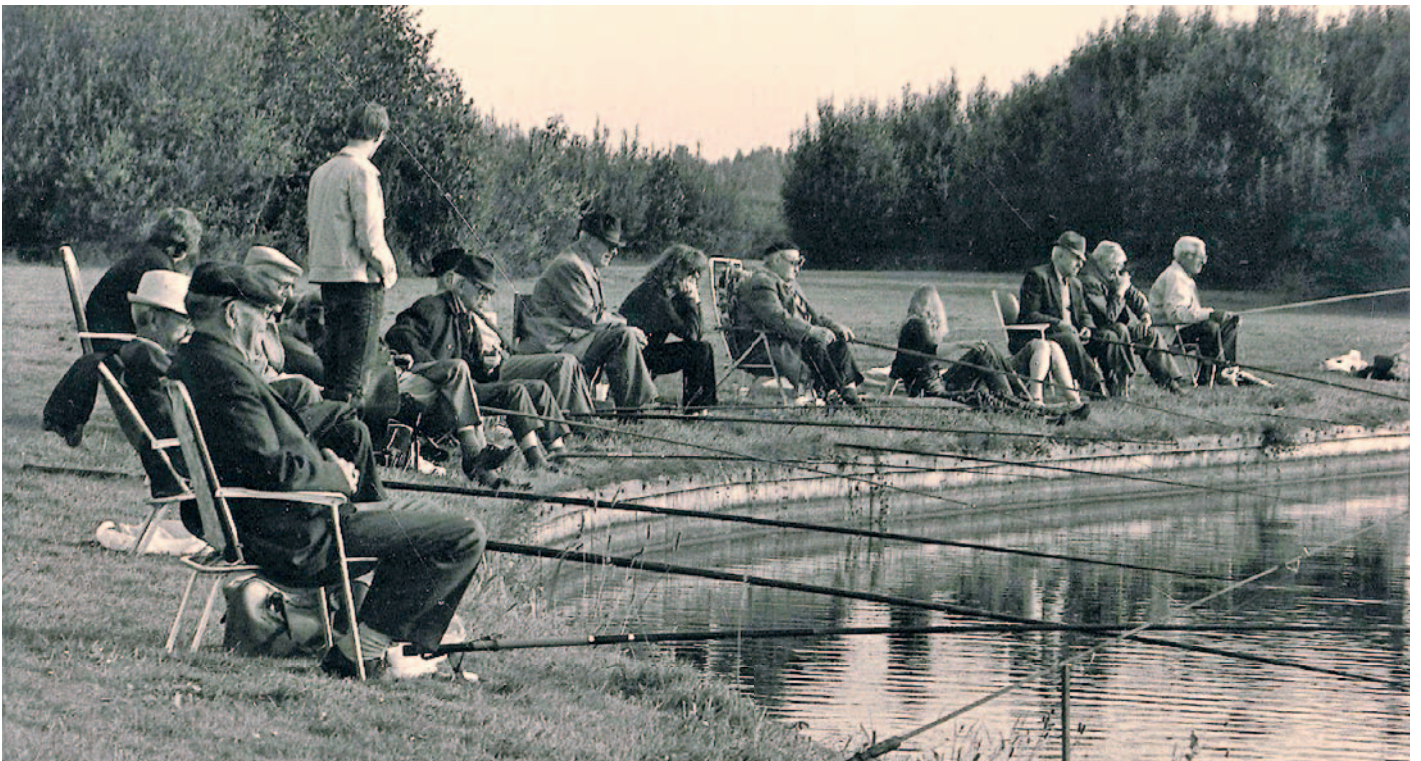
Vistochtje voor bewoners, 1980.