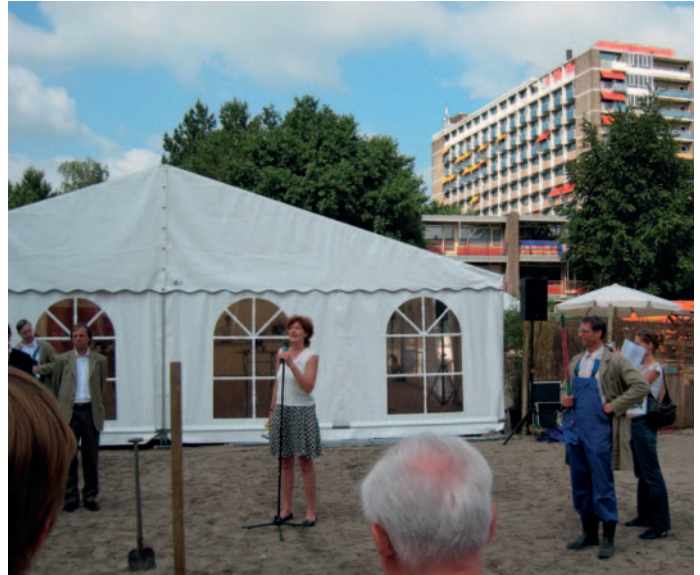
Eerste paal Dollardplein, 2007.