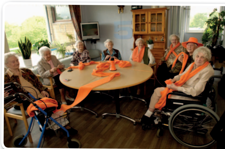
Breien voor het wereldkampioenschap voetbal, 2006.