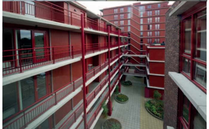
De architect heeft de rode achtergrond van Het Schouw verwerkt in kleurstelling nieuwbouw