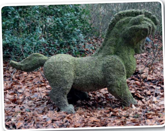
Het paard van meneer Vleeschhouwer.

Nou, dat vonden wij goed. Dat paard heeft eerst bij de vijver gestaan en later bij het restaurant. Nu staat het in de Heemtuin. In andere huizen hadden ze dat nooit toegestaan!"