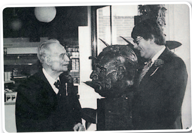
Willem Drees met directeur Mulder, 1977.

We moeten niet vergeten dat Het Schouw toen een verzorgingshuis was en nu vooral een verpleeghuis. De vitaliteit van bewoners nam toen ook wel af, maar was toch groter dan nu. Anton “Toen de bewoners in Het Oude schouw kwetsbaarder werden, werden op de etages ook activiteiten georganiseerd zoals bloemschikken, film kijken, sjoelen, bingo en pannenkoeken bakken. Eigenlijk net als nu”.