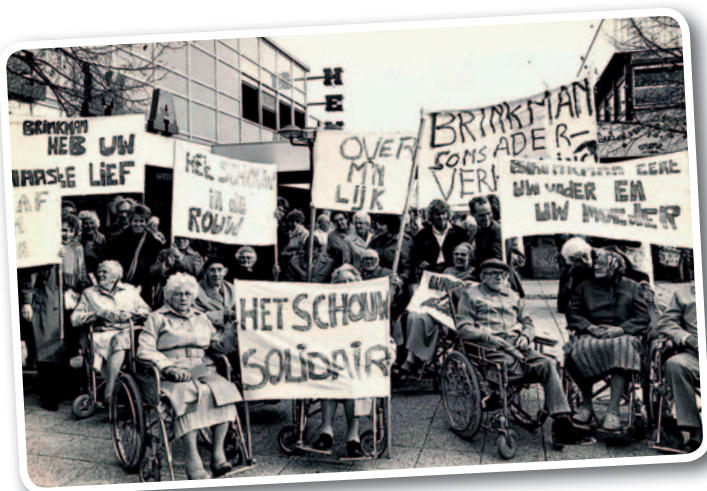
Bewoners demonstreren in winkelcentrum

Een groep bewoners van Het Schouw nam per bus deel aan de grote demonstratie tegen de plaatsing van nieuwe kernwapens in ons land op 21 november 1981.