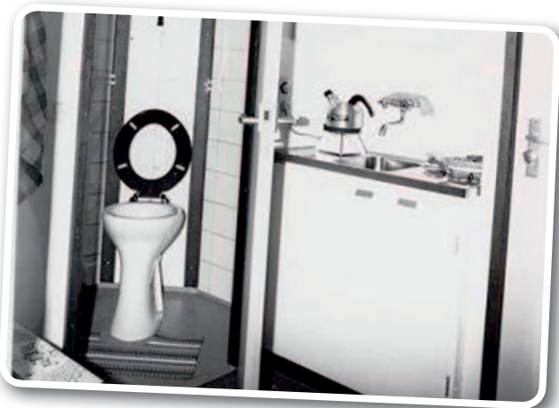
Badkamer(tje) met keukenblok, woonkamer en winkeltje.