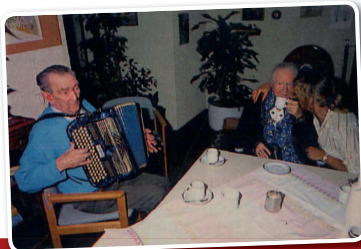
Gezelligheid op het koffiezitje bij de lift

Dilo: "Hij was enthousiast over het Schouw, het was zijn huis. Hij had ook een vogel thuis. Die mocht hij niet op zijn kamer hebben, die had hij op de gang staan. Hij verzorgde ook de vissen. Hij verzorgde veel op de gang, voor anderen ook. Ja, hij hield van mensen. Als iemand met iets kwam en hij kon dat dier niet verzorgen, dan deed hij dat wel".