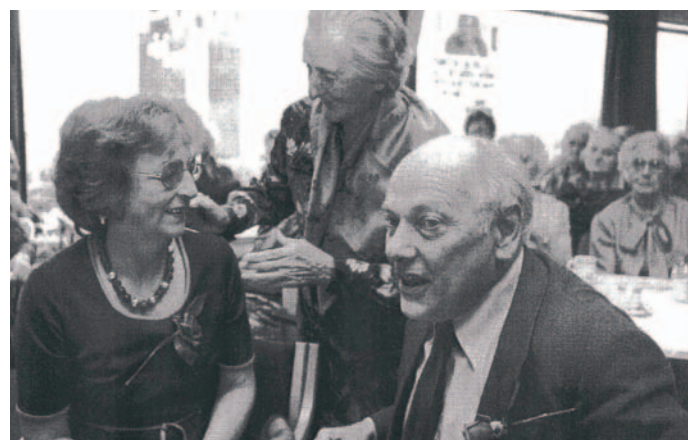
Joop en Liesbeth den Uyl, 1979.