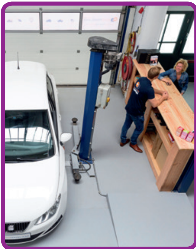
Locatie Automakelaar aan huis