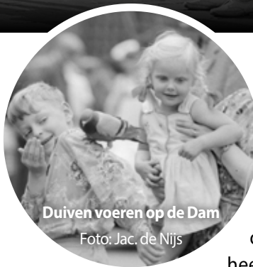
Duiven voeren op de Dam

Een uitstapje naar de speeltuin zorgde voor kriebels in de buik. "...En dan gaan we naar de speeltuin en we wippen en we draaien en we schommelen erg fijn tot we mis'lijk van het draaien en de limonade zijn...", zong Heleentje van Cappelle in 1951. Op vakantie gaan in de naoorlogse jaren was nog niet gewoon. Halsreikend werd uitgekeken naar een dagje Artis of naar een verfrissende duik in het De Miranda openluchtzwembad met zonneweide.