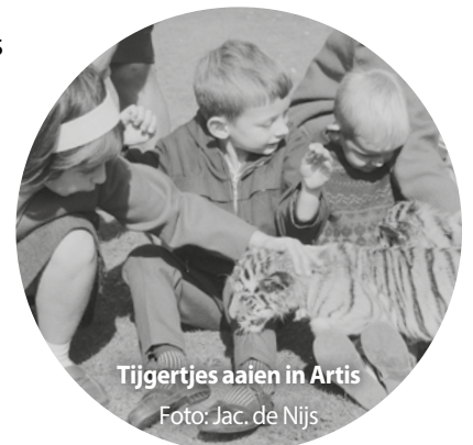
Tijgertjes aaien in Artis

Op vakantie gaan, kamperen met de tent of al wat luxer met vouwwagen of caravan, werd populairder in Nederland. Men reisde per fiets, brommer of afgeladen auto met de piepers in de achterbak. En de tieners van toen, zij proefden in 1969 in minirok of hotpants, met vetkuif of lange haren, van een nieuwe vrijheid dankzij de Tienertoerkaart van de Nederlandse Spoorwegen.