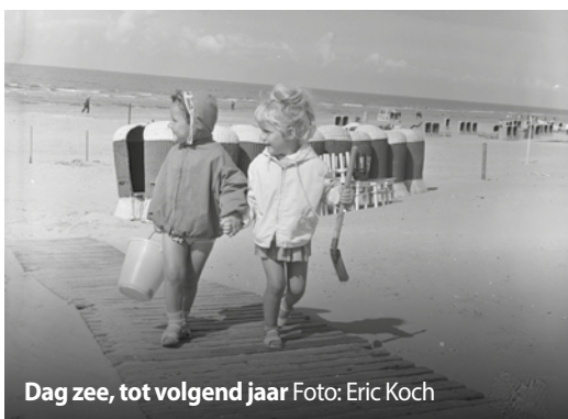
Dag zee, tot volgend jaar

Knikkeren en bikkelen, hinkelen en tollen, touwtje springen, fietsen met de vliegende Hollander, op stelten lopen, hoepelen, ballen, lummelen, verstopperijtje spelen of diefje met verlos, steppen, rolschaatsen of kaatsenballen, vissen of slootje springen. Met de straat als speeldomein verveelden de kinderen van toen, met hun tomeloze energie, zich geen moment.