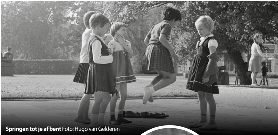
Springen tot je af bent

De zomers van vroeger, er leek geen einde aan te komen.