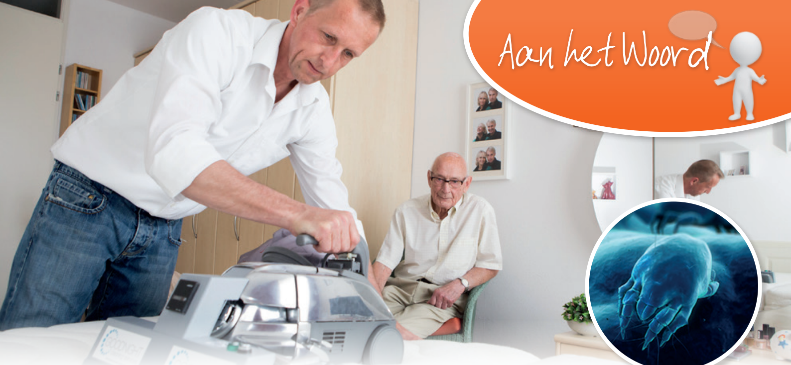
Matrasluis, sterk uitvergroot